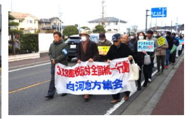
横断幕を掲げデモ行進スタート