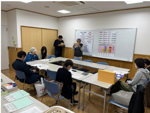
東白支部書き上げ会の様子

各支部の書き上げ会は3月10日(火)が最終になります。 書き上げ会に参加できていない、申告書ができていない、出来上がったが直したいなどありましたら早めに事務所までご連絡ください。